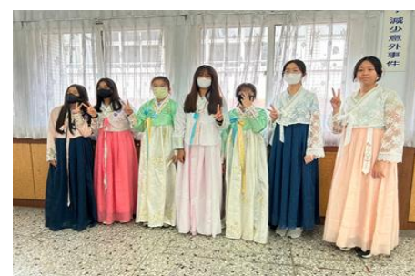
達德商工日韓文化體驗活動