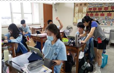
九年級模擬志願選填