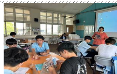
輔導室生涯講座-建教合作宣導