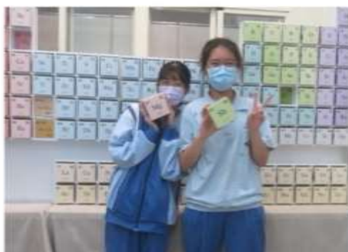
爭取元素週期表特展到校展出