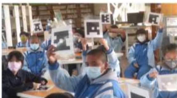
明日數學王擂台賽