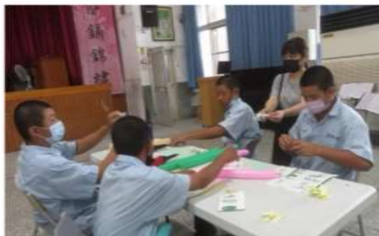
邀請科博館的科老師入校帶自然體驗課程