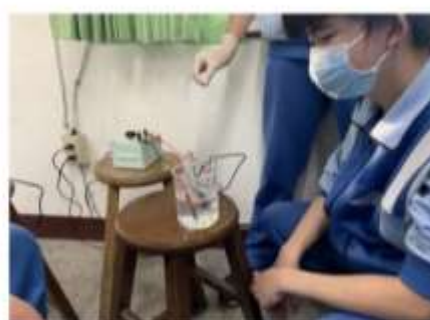
素養導向的科學實驗探究